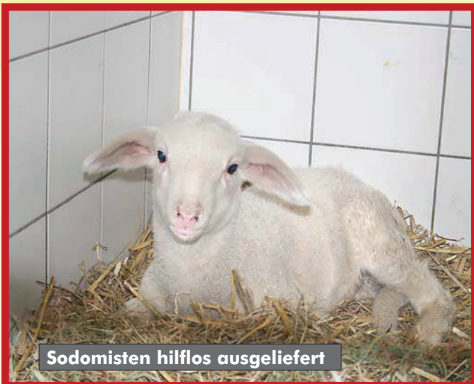
Sodomisten hilflos ausgeliefert

Ein 35jähriger verletzt Muttersau und Kuh bei einer Schändung schwer, ein 30jähriger vergeht sich an Hühnern, die in Folge der Penetration jämmerlich verenden. Ein Unbekannter missbraucht einen Kater, der sich mit blutendem After nach Hause schleppt und notoperiert werden muss. Eine Schäferhündin erduldet für die sexuellen Obsessionen ihres Halters unsägliche Qualen, und eine sieben Kilogramm schwere Yorkshirehündin muss die körperliche "Liebe" eines ausgewachsenen Mannes über sich ergehen lassen. Einzelfälle?