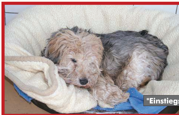
"Einstiegserfahrung" an Hunden

Es bleibt die grundsätzliche Annahme von Sexualtherapeuten, Psychologen, Tierärzten und Tierschutzorganisationen, dass die Sexualität mit Tieren mit einer Dunkelziffer belegt ist und in bestimmten Kreisen als "Lifestyle" betrachtet wird. Hinweise auf eine zunehmende Anhängerschaft geben u.a. die Verfechter selbst, die um die gesellschaftliche und gesetzliche Anerkennung ihrer "sexuellen Orientierung" bemüht sind.